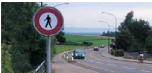
Accès interdit aux piétons