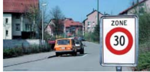
Zone 30 km/h