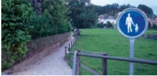
Chemin pour piétons