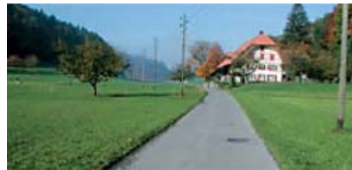
Route secondaire à faible circulation sans trottoir et sans chemin pour piétons / piste cyclable