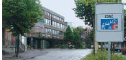
Zone de rencontre